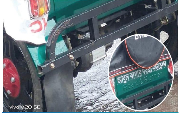
অসহায় অসচ্ছল মানুষকে ব্যাটারি চালিত অটোরিকশা প্রদান, মানিকগঞ্জ