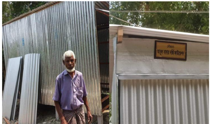
গৃহহীন মানুষকে ঘর প্রদান, ঘিওর, হিজুলিয়া, মানিকগঞ্জ