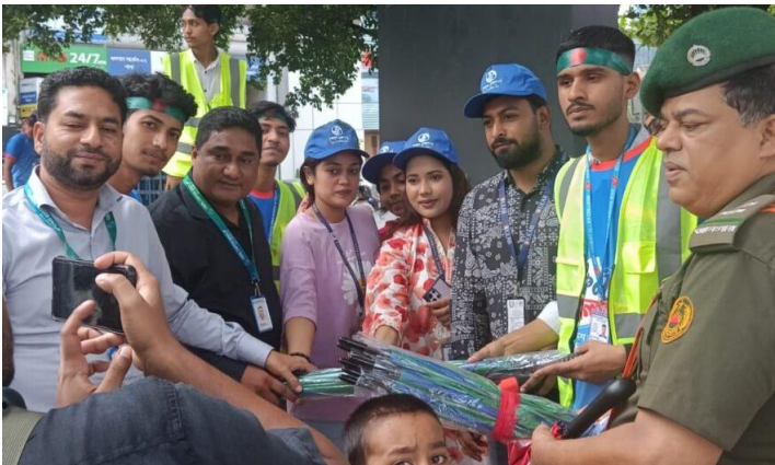
তীব্র গরমে নগরবাসীকে স্বস্তি দিতে ঢাকায় শিক্ষার্থী ও নিম্নআয়ের মানুষের মাঝে বিনামূল্যে ছাতা বিতরণ কর্মসূচি...