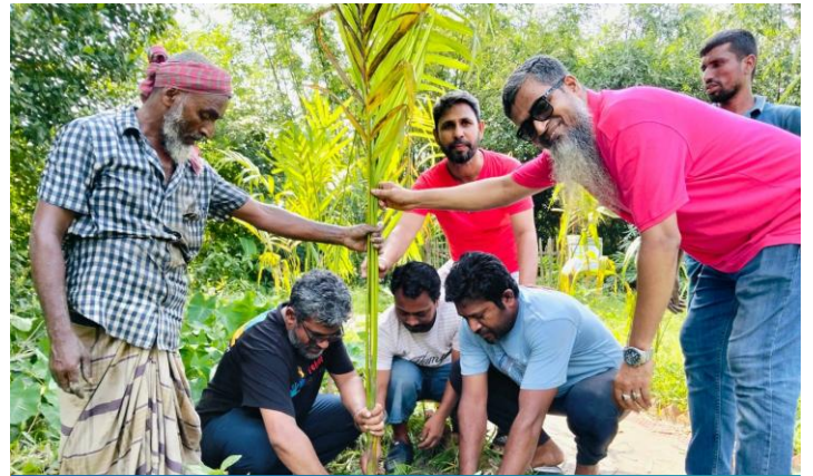
বৃক্ষরোপণ কর্মসূচীর একাংশ