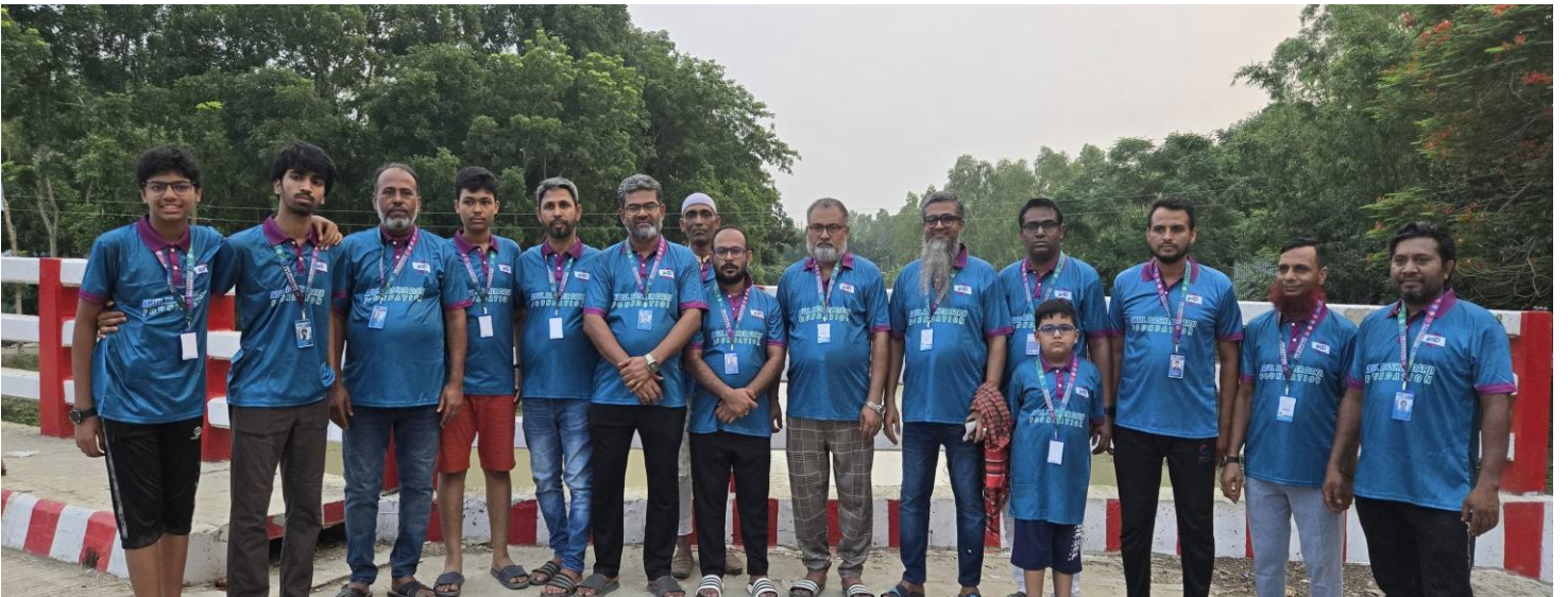
কোরবানী ঈদে প্রতিবছর গরু গোশত বিতরণ কার্যক্রম, যারা কোরবানী দিতে অক্ষম তাদের মাঝে হাসি ফুটানোর ক্ষুদ্র প্রয়াস।