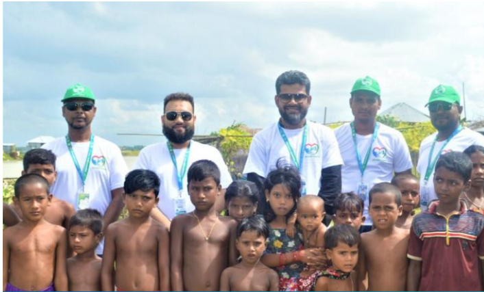
ছিন্নমূল মানুষের মাঝে ইদ উপহার সামগ্রী বিতরণ, মানিকগঞ্জ