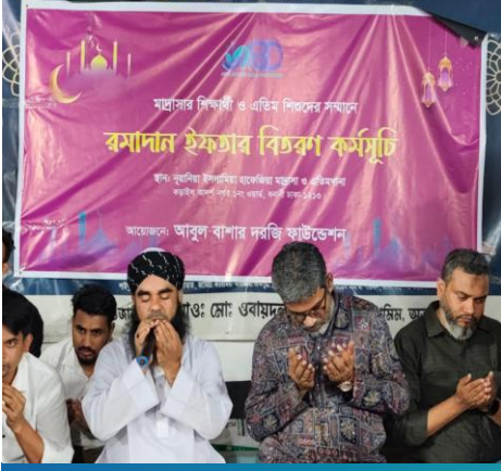
এতিম শিশুদের মাঝে ইফতার বিতরণ কর্মসূচী