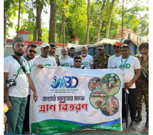
কুমিল্লায় বন্যার্ত মানুষের মাঝে ত্রাণ বিতরণ