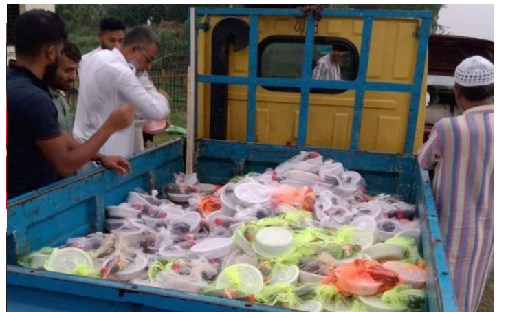
ঈদের দিন সুবিধাবঞ্চিতদের মাঝে ঈদ খাবার বিতরণ