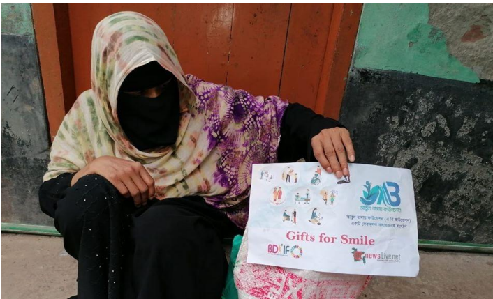
ঈদ উপহার সামগ্রী বিতরণ, মানিকগঞ্জ