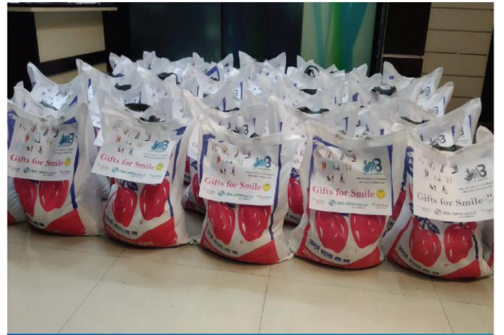
ঈদ উপহার সামগ্রী বিতরণ