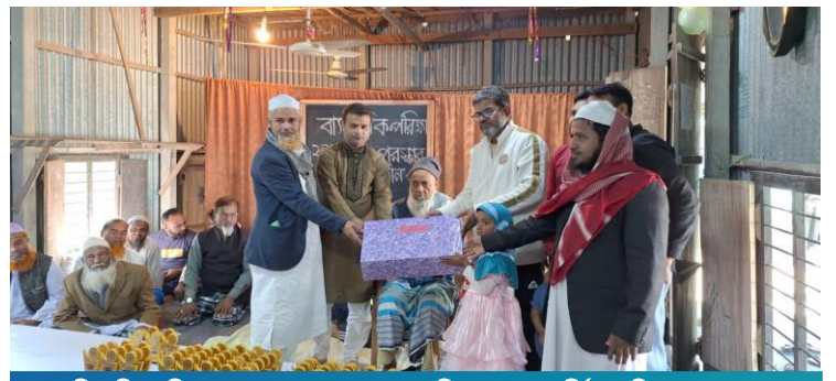
হিজুলিয়া হিলফুল ফুযুল মাদ্রাসা ও এতিমখানায় বার্ষিক পরিক্ষায় ভালো ফলাফল অর্জন করায় ছাত্র-ছাত্রীদের পুরস্কার প্রদান ।