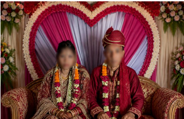
বাবাহীন পরিবারের পাশে এবিডি ফাউন্ডেশন