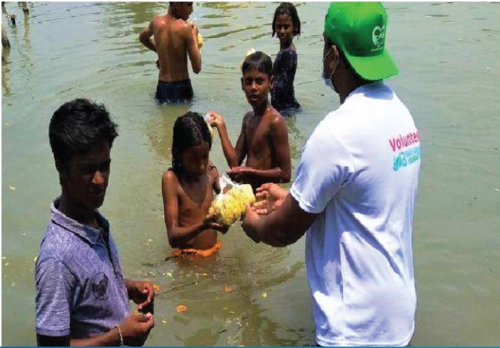
পানিবন্দি মানুষের মাঝে খাদ্য সামগ্রী বিতরণ, সাতক্ষীরা