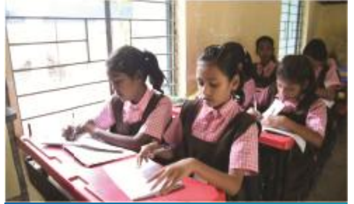
বৃত্তি প্রদান অনুষ্ঠান