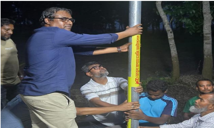
মানিকগঞ্জের হিজুলিয়া গ্রামের কেন্দ্রীয় কবরস্থানসহ রাস্তা ও বাজারে সোলার লাইট প্রকল্পের একটি খণ্ডচিত্র ।