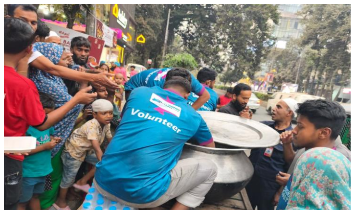
রমজানে সুবিধাবঞ্চিতদের মাঝে ইফতার বিতরণ