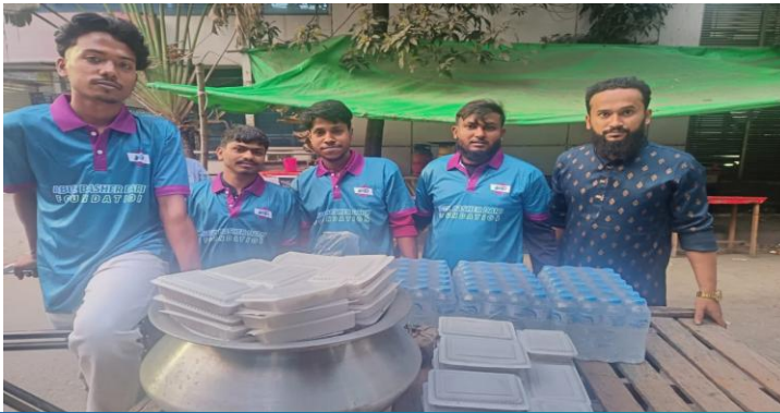
রমজানে সুবিধাবঞ্চিত এবং পথিকদের মাঝে ইফতার বিতরণ