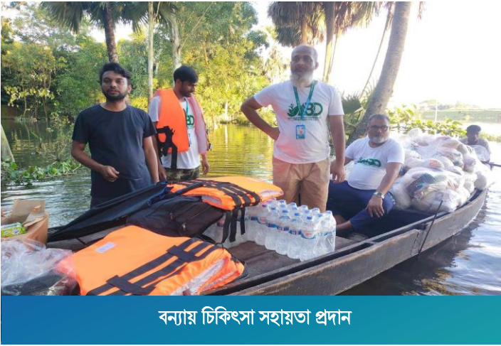
বন্যায় চিকিৎসা সহায়তা প্রদান