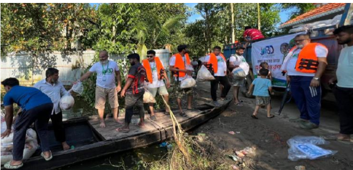
বৃহত্তর চট্টগ্রাম অঞ্চলে বন্যায় ক্ষতিগ্রস্তদের আণ সরবরাহ কর্মসূচী।