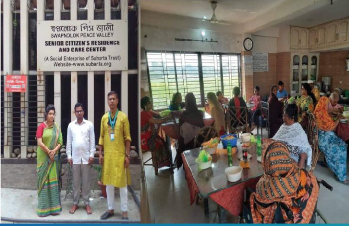
ঢাকার শ্যামলীতে স্বপ্নলোক পিস ভ্যালীচ বৃদ্ধাশ্রমে ইদে খাবার প্রদান।