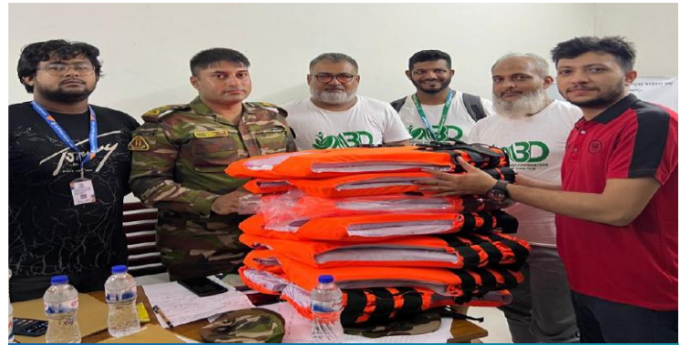
কুমিল্লায় আন শিবিরে আন সহায়তা সেবা ।