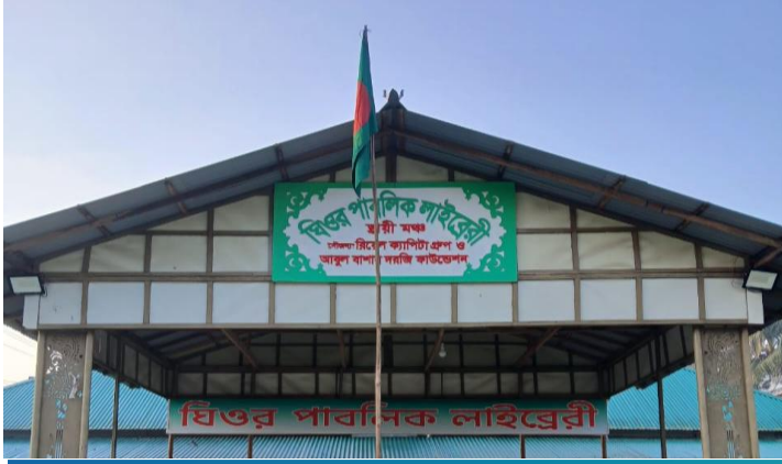
ঘিওর পাবলিক লাইব্রেরী, মানিকগঞ্জ