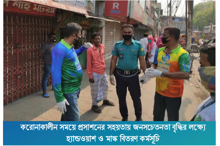
করোনাকালীন সময়ে প্রশাসনের সহায়তায় জনসচেতনতা বৃদ্ধির লক্ষ্যে হ্যান্ডওয়াশ ও মাস্ক বিতরণ কর্মসূচী