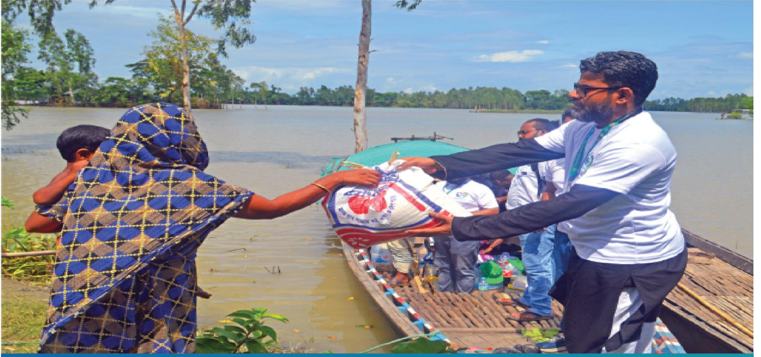
মানিকগঞ্জ বন্যায় আন সহায়তা সেবা