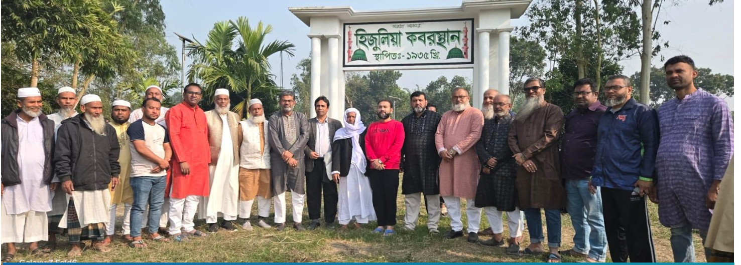
হিজুলিয়া কেন্দ্রীয় কবরস্থানের সৌন্দর্য্যবর্ধনে এবিডি ফাউন্ডেশন