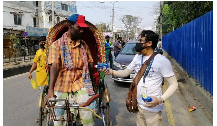
করোনাকালীন সময়ে জনসচেতনতা বৃদ্ধির লক্ষ্যে হ্যান্ডওয়াশ ও মাস্ক বিতরণ কর্মসূচি