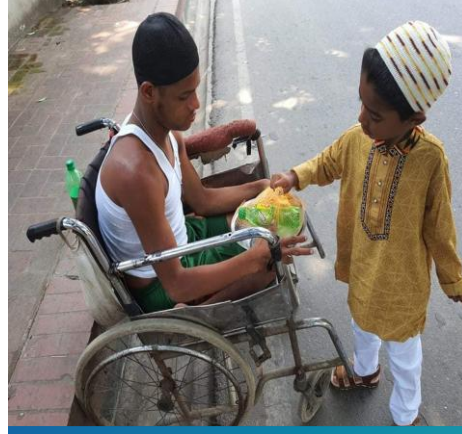
বিশেষ চাহিদা সম্পন্ন ব্যক্তিদের সহায়তা